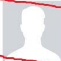
Raiz de Davi